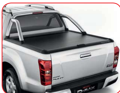
ROLL COVER * *STYLE BAR IN OPTIE